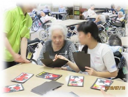
学生さんとの交流会