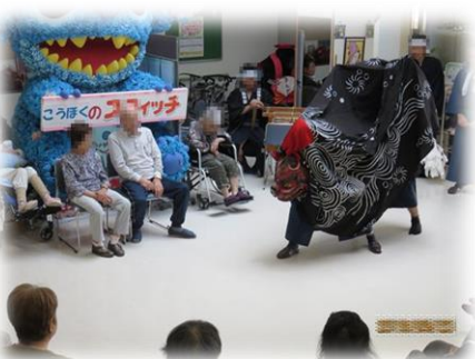
地域の方との交流会