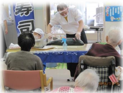
ブリの解体ショー